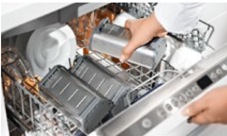
ORGA-LINE įrankių dėklai ir skirtukai