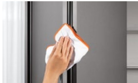
Į nišą įvažiuojančių durų sistema