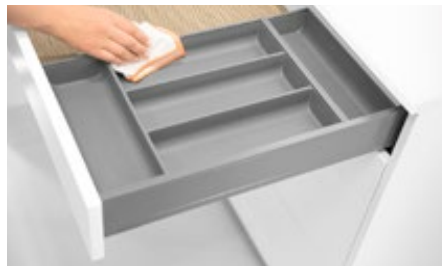
AMBIA-LINE įrankių dėklai, plieno kolekcija