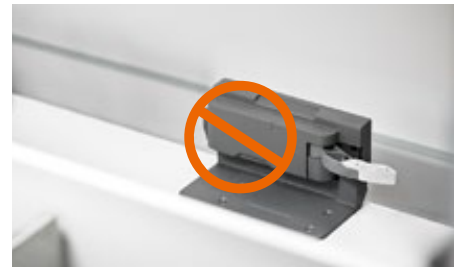
SERVO-DRIVE elektrinė atidarymo sistema