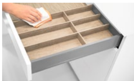
AMBIA-LINE įrankių dėklai, medžio dekoru kolekcija