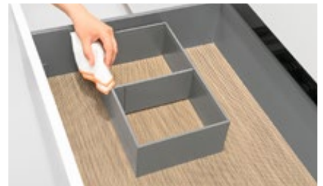
AMBIA-LINE rėmeliai, plieno kolekcija