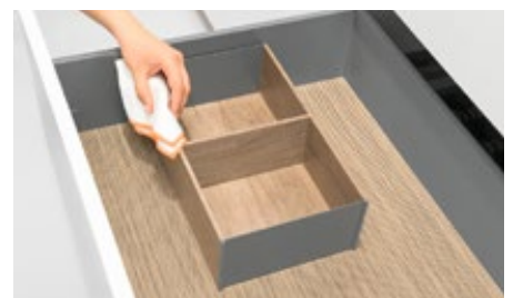
AMBIA-LINE rėmeliai, medžio dekoru kolekcija